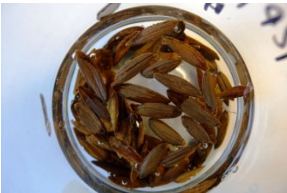
Ocena jakości nasion jesionu wyniosłego