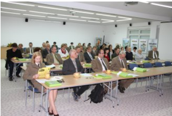
Seminarium otwierające projekt FraxUmLBG 26.06.14