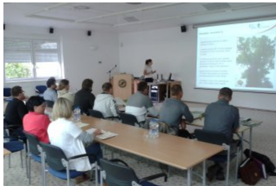
Szkolenia dla wykonawców zbioru 08-09.14r.