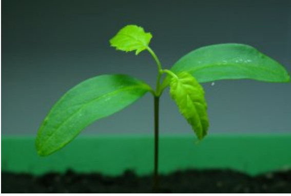
Siewka - Jesion wyniosły ( Fraxinus excelsior L.)