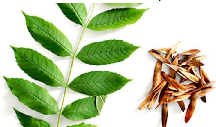
Jesion wyniosły Fraxinus excelsior L.