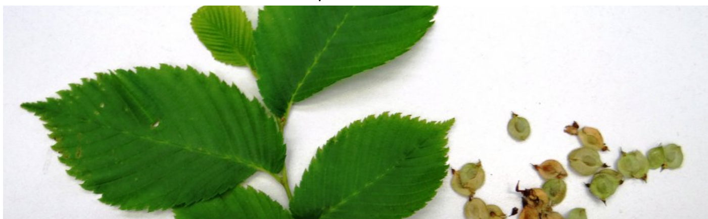
Wiąz szypułkowy Ulmus laevis Pall.